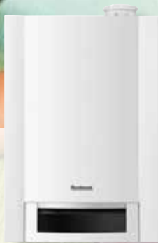
Logamax plus GB172 Logamax plus GB172T50